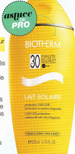
Lait solaire au parfum d'agrumes avec FPS 30, de Biotherm, 35 $ les 200 ml