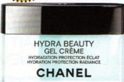
Crème Photoderm avec FPS 60, de Bioderma, 20 $ les 40 ml Gel crème Hydra Beauty, de Chanel, 78 $ les 50 g